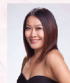
葉葆菁 香港著名女高音