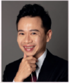
譚子輝 著名指揮及雙簧管演奏家