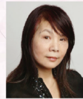
羅乃新 香港著名鋼琴家