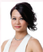
梁頌儀 香港著名女高音