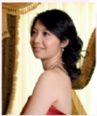
譚懷理 著名豎琴演奏家及教育家