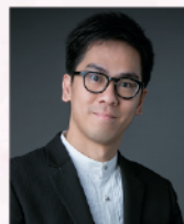
魏龍勝 著名指揮及小號演奏家