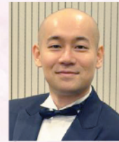
盧嘉博士 國際著名鋼琴演奏家