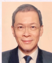
鄺永然 香港著名鋼琴家