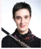
Izaskun Erdocia 著名長笛演奏家