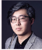
李一葦 長笛演奏家及作曲家