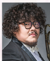
鄭啟明 旅法長號演奏家