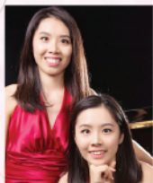
周樂嫻 & 周樂婷 著名二重奏及雙鋼琴演奏家