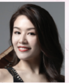
謝欣燕 香港豎琴演奏家及教育家