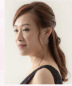
馬家敏 香港著名長笛演奏家