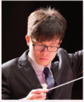
郭浩賢博士 Mississippi Valley Orchestra指揮 The American Prize指揮大賽優勝者