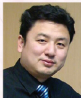
遇陽博士 中國著名鋼琴教育家