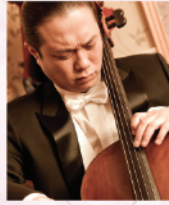
倪文強 香港著名大提琴演奏家