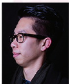
吳漢紳 國際薩克斯風演奏家