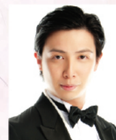
梁文尊博士 香港著名鋼琴家