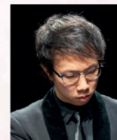
劉沛恩博士 旅美鋼琴演奏家