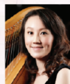
施盈琳 香港著名豎琴演奏家 及教育家