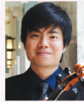
黃竣恆博士 旅美小提琴演奏家