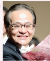
洪昶 中國著名鋼琴教育家