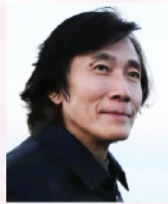
蔡崇力教授 國際鋼琴演奏家及教育家