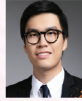
郭承豐博士 旅美小提琴演奏家