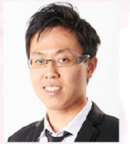
薛子豪 旅美小提琴演奏家