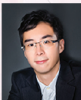
周達勳博士 旅美鋼琴演奏家