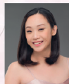
張吟晶 香港頂尖青年女中音歌唱家