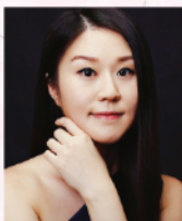
辛豆豆 旅美著名鋼琴家