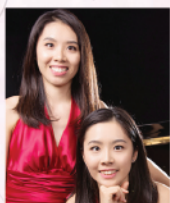
周樂嫻 & 周樂婷 著名二重奏及雙鋼琴演奏家