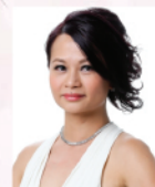
梁頌儀 香港著名女高音