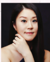
辛豆豆 旅美著名鋼琴家