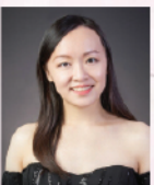
鄺勵齡 香港著名女高音