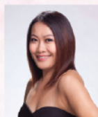
葉葆菁 香港著名女高音