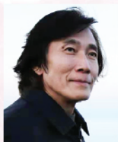
蔡崇力教授 國際鋼琴演奏家及教育家