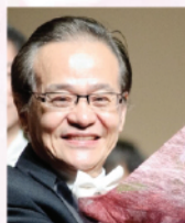
洪昶 中國著名鋼琴教育家